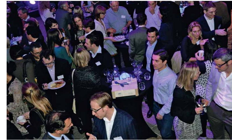
Der Südstern-Jahresevent findet jedes Jahr am 28.12. in Südtirol statt, wo Kommunikation und Austausch im Vordergrund stehen

Mit Südstern Campus wurde Ende 2011 eine Initiative gestartet, die ambitionierten Studenten die Möglichkeit gibt, bei Südstern einen Mentor zu finden, der bei den ersten Karriereschritten im Ausland zur Seite steht. Unter diesen